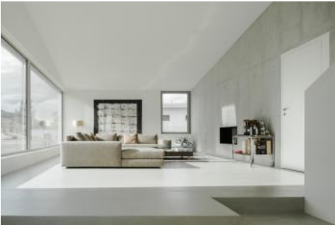
Der überhohe Wohnbereich schafft eine grosszügige Atmosphäre.

Vorstellungen verknüpft. Mittelpunkt des familiären Lebens bildet eine Wohnlandschaft, welche Zonen auf unterschiedlichen Niveaus offen miteinander verbindet. Eine raumhaltige Wand trennt diesen gemeinschaftlichen Raum von den Schlafzimmern und wird von beiden Seiten durch Einbauten unterschiedlicher Art aktiviert. Einmal pro Niveau wird die Wand durchdrungen. Auf diese Weise schafft sie eine Unmittelbarkeit zwischen der Gemeinschaft der Familie und der Privatsphäre ihrer einzelnen Mitglieder.