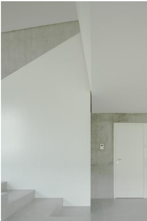
Eine breite Treppe verbindet Wohn- und Essbereich und lädt zum Sitzen ein.

Das Haus befindet sich inmitten eines dicht bebauten Quartiers am Damm eines kleinen Baches. Um auf verschiedenen Ebenen eine Verbindung zum umlaufenden Garten zu schaffen, wurde das Gebäude als Split-Level konzipiert. Dies ermöglicht eine offene Abfolge von Räumen mit unterschiedlichen Intimitätsgraden, Lichtqualitäten und Ausrichtungen. Die Topographie der Umgebung wird künstlich übersteigert und im Innenraum fortgeführt.