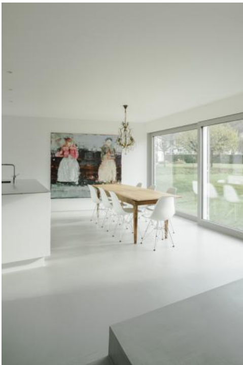
Der Essbereich ist über eine Hebeschiebetüre mit dem Aussenraum verbunden.